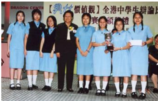
正方主辯 正方第一副辯 正方第二副辯 正方結辯