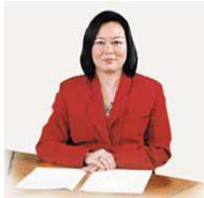
平等機會委員會主席 胡紅玉女士

「據美國聯邦儲備局主席格林斯潘表示，種族歧視和其他形式的歧視對社會經濟均造成影響——就是減少盈利。」 1