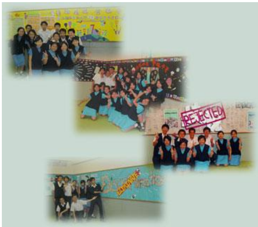
學生及他們設計的壁報

聖公會鄧肇堅中學(灣仔區)今年以平等機會為題，舉辦一系列活動，其中包括班際壁報設計比賽。讓我們一起分享優勝者的喜悅！