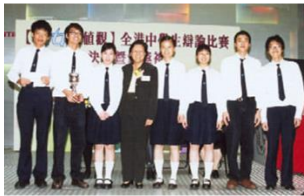
反方主辯 反方第一副辯 反方第二副辯 反方結辯